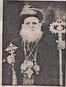
പ. ബസ്സേലിയോസ് ഗീവർഗ്ഗീസ് ദിതിയൻ കാതോലിക്കാ ബാവ